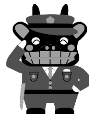
青葉警察署 マスコットキャラクター 青葉守護丸巡査